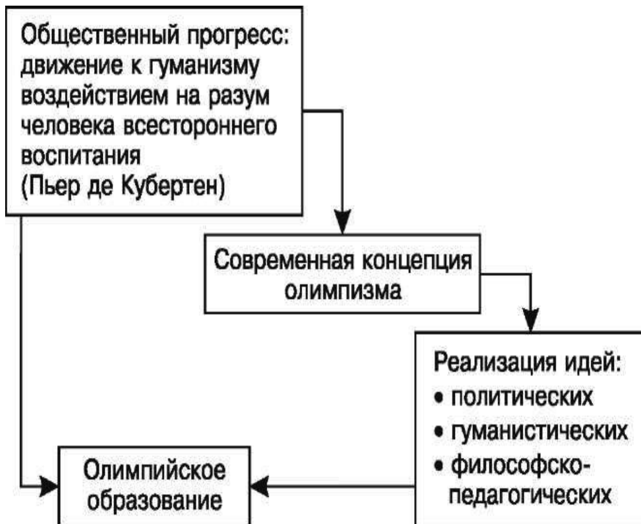
Рисунок 1.2. Основа олимпийского образования – олимпизм

Олимпийское движение и воспитание нравственно-эстетического отношения к спорту // Проблемы олимпийского движения / под ред. А. Солакова. БОК, София–Пресс, 1977; Твой олимпийский учебник. М., 1996; Матвеев С., Радченко Л., Щербашин Я. Олимпийское образование от Древней Греции до современности // Наука в Олимпийском спорте. 2007. С. 47; С. 125-138; Гулюта О.В. Терминологический аспект олимпизма // Современный олимпийский спорт и спорт для всех. Минск, 2007. С. 17-20).